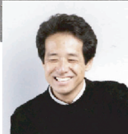
西村幸夫（にしむらゆきお） 1952年福岡市生まれ。東京大学工学部都市工学科卒、同大学院修了。96年より東京大学教授。専門は都市計画。工学博士。著書に『環境保全と景観創造』（鹿島出版会・1998年）、『町並みまちづくり物語』（古今書院・1998年）、『都市保全計画』（東大出版会、2004年）